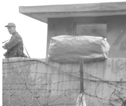
DECT-Gefängnis in Diyarbakir.

Schikanen und Verbote prägen das Leben in dem Spezialgefängnis. So ist es untersagt, Papier und Bleistifte in