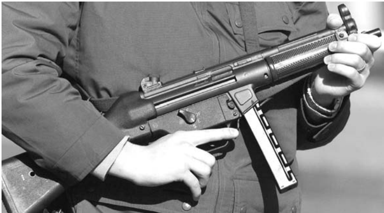
Die Maschinenpistole MP5: Dank der Lizenzvergaben von Heckler & K Koch weltweit im Einsatz.

Da mag die H&K-Pressestelle noch so sehr betonen, die Firma sei unschuldig am weltweiten Morden mit Heckler&Koch-Waffen. Die Realität sieht anders aus.