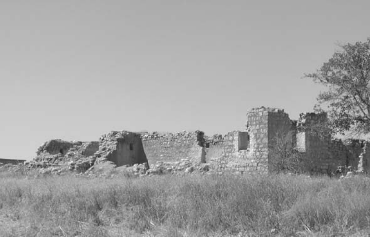
Ein im Bürgerkrieg zerstörtes Dorf an der Straße nach Mardin.

es handelte sich um eine Auseinandersetzung im Land. Es gibt Protokolle. Die Informationsabteilung der Armee war an diesem Tag dabei. Ich glaube, Militäraufnahmen existieren nicht. Womöglich aber Privatfotos.«