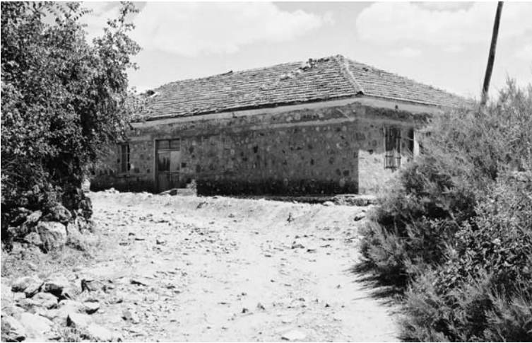
Die Schule in Tiyaks.

Im Ortskern stehen die alte und eine neue Moschee, befinden sich ein Krankenhaus und ein Büro für landwirtschaftliche Untersuchungen sowie eine Grund- und eine Sekundarschule. Mit dem Schulbesuch fast aller Bewohner ist der Bildungsstandard gestiegen, die Menschen in Tiyaks sind für ihr Wissen bekannt. Kein Wunder, dass das Dorf drei bekannte Parlamentarier hervorgebracht hat.