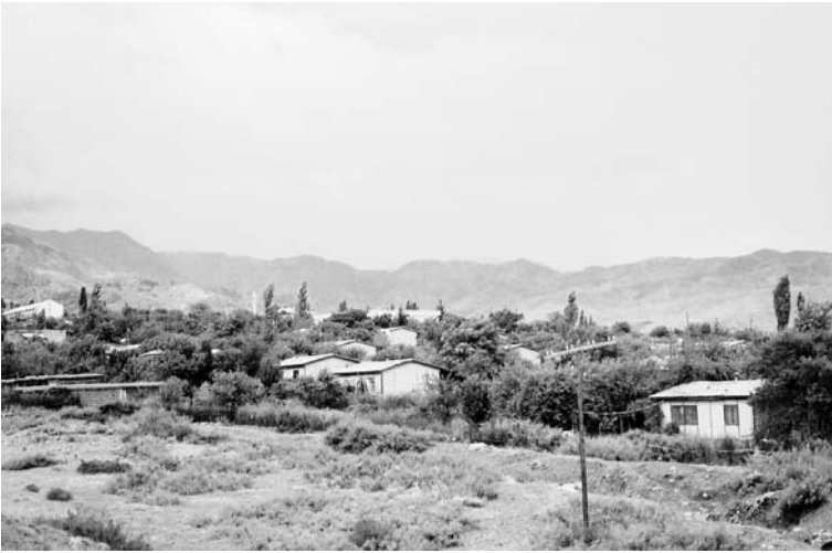
Tîyaks liegt in einem grünen Tal unterhalb des Ömer-Bergs.