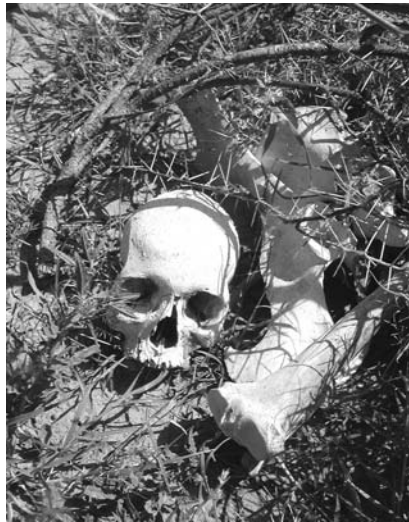
Menschliche Überreste am Ufer des Dooxa Herer.

In der Regenzeit wird der ausgetrocknete Dooxa Herer urplötzlich zu einem reißenden Strom. Das Wasser frisst sich ins Erdreich hinein und spült weitere Getötete frei. So können während der Sommermonate Schädel- und Oberschenkelknochen, Becken und Brustkörbe, die am Prallhang aus dem Erdreich herausragen, von den Fluten mitgerissen werden. Das ist die Zeit, in der die Familienangehörigen wieder nach ihren Vermissten suchen. Hunderte von Menschen kommen zu den Massengräbern und versuchen, ihre Angehörigen am persönlichen Eigentum zu identifizieren, einem Stück Stoff vielleicht oder einer Uhr.