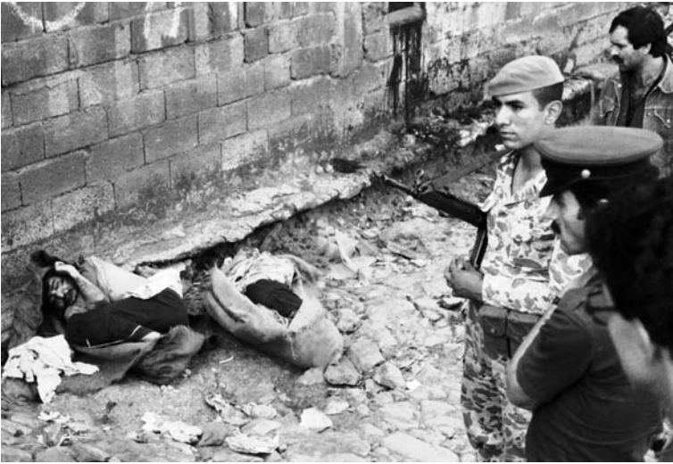
Zu Tode Gefolterte am Straßenrand, bewacht von einem Soldaten mit G3.