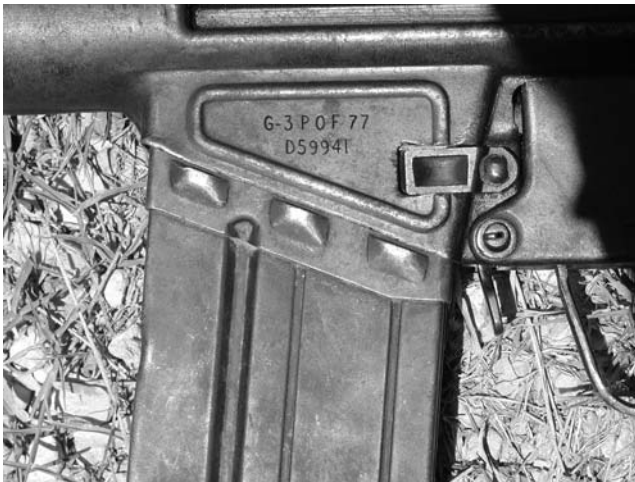
Die Gewehrnummer G-3 P.O.F. 77 D59941 verrät, dass dieses G3 1977 bei der Pakistan Ordnance Factory in Lizenz gefertigt worden ist.

»Das Modell G3A3 mit der kurzen Schulterstütze ist die teuerste Version. Da sie gut zu verbergen und leicht transportierbar ist, kostet sie hundertfünfzig Dollar. Die zweit teuerste Waffe ist das G3 mit Bipod. Auch Schalldämpfer und Bajonette sind nicht billig, die kann ich nur in begrenzter Zahl beschaffen.« Mr. Farah