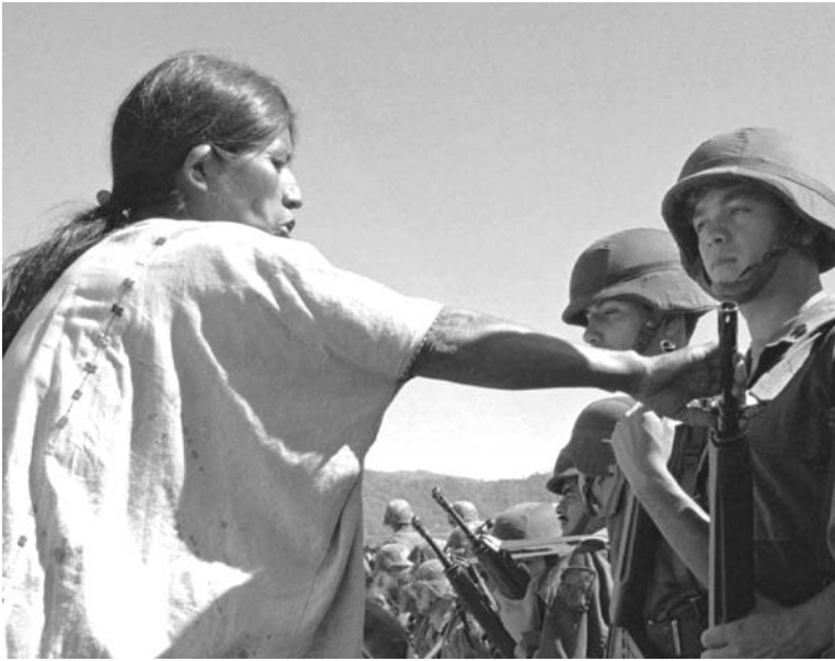
Einsatz des G3 in Mexiko