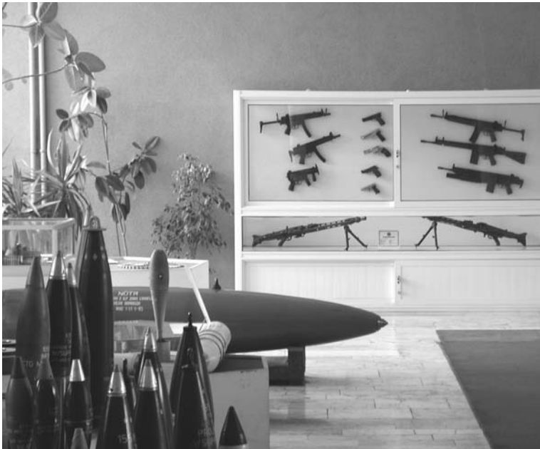
Der Empfangssaal der Rüstungsfirma MKE mit den dort ausgestellten Waffen.

Dieses Waffenarsenal ist ein Traum für jeden, der den Krieg als Fortsetzung der Politik mit militärischen Mitteln ansieht. Es ist die Hölle für jeden, der die Zerstörungskraft dieser Waffen im