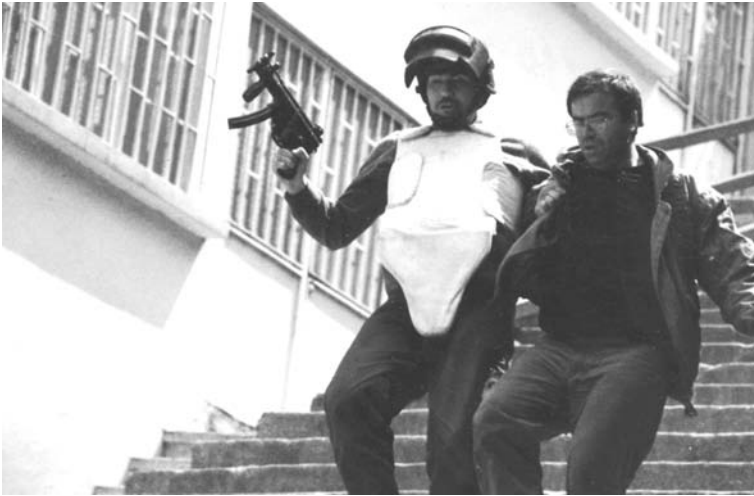
Ein mit einer MP5 bewaffneter Angehöriger einer türkischen Sicherheitseinheit führt einen Gefangenen ab.

diese klar: »Die Bundesregierung verfügt über keine rechtlichen Möglichkeiten, die Rücknahme der Lizenz zu erzwingen.«